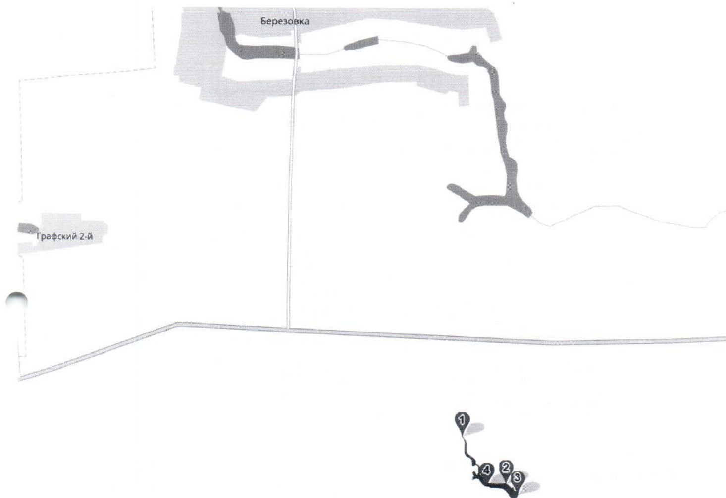
Схема рыбоводного участка № 8, расположенного в 3,5 км южнее с. Березовка и находящегося в русле ручья Подгорный Уваровского района, Тамбовской области, площадью 5,0 га

Текстовое описание с координатами: 51°58'06" северной широты и 42°04'46" восточной долготы по береговой линии до точки № 2 с координатами 51°57'51" северной широты и 42°05'06" восточной долготы, далее до точки № 3 с координатами 51°57'49" северной широты и 42°05'12" восточной долготы, далее до точки № 4 с координатами 51°57'51" северной широты и 42°04'56" восточной долготы, далее по береговой линии до точки № 1, с целью ведения аквакультуры.